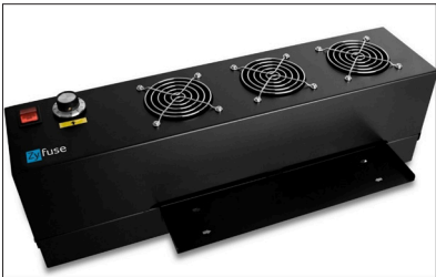
HORNO ZY FUSE para producción de imágenes en relieve.