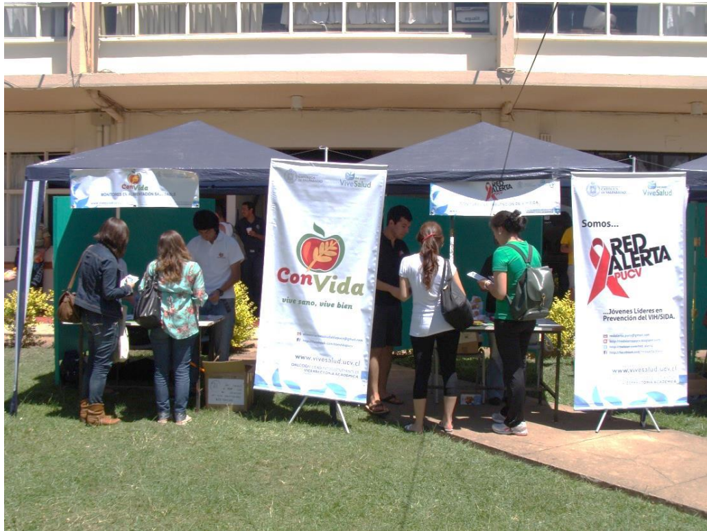
Redes CONVIDA y ALERTA en Intervención Socioeducativa