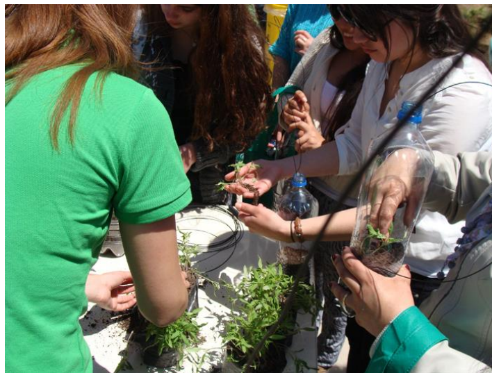
Taller Huertos Urbanos. 2014

5.- Alerta Temprana y Seguimiento: Sistema de tecnologías de acceso de información, que permita el seguimiento de los rendimientos académicos de los estudiantes, de las asignaturas que presentan alta reprobación, de resultados intermedios, y que permita gestionar derivaciones.