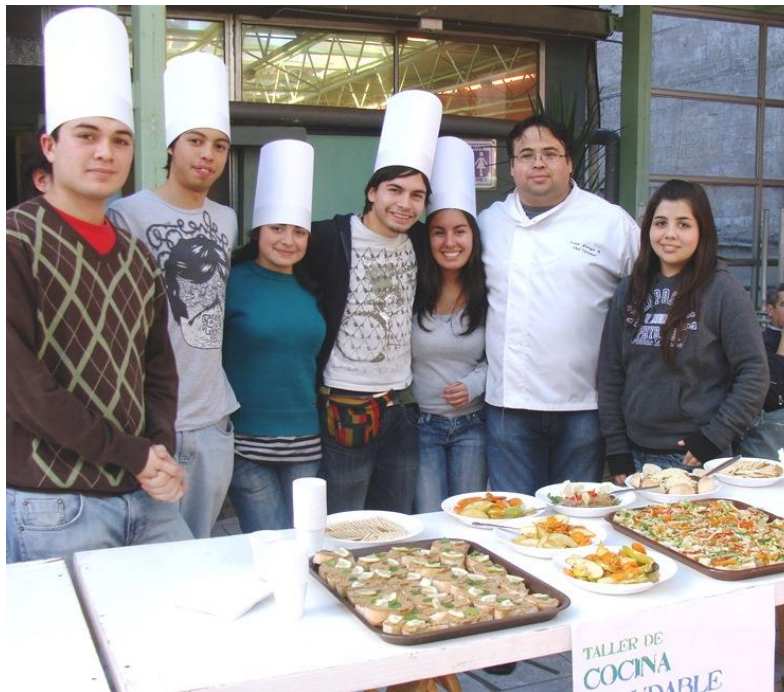
Taller de Cocina Saludable

Por su parte, los seminarios recrean espacios formativos de convocatoria abierta, de tres horas de duración, durante una sesión, cuyo objetivo es entregar a los estudiantes asistentes información y/o conocimiento que les permita cimentar las bases para la formación de alguna habilidad o conocimiento específico. En los seminarios se entregan herramientas conceptuales que le permite al estudiante orientar su propio aprendizaje y desarrollo de una habilidad transversal específica.