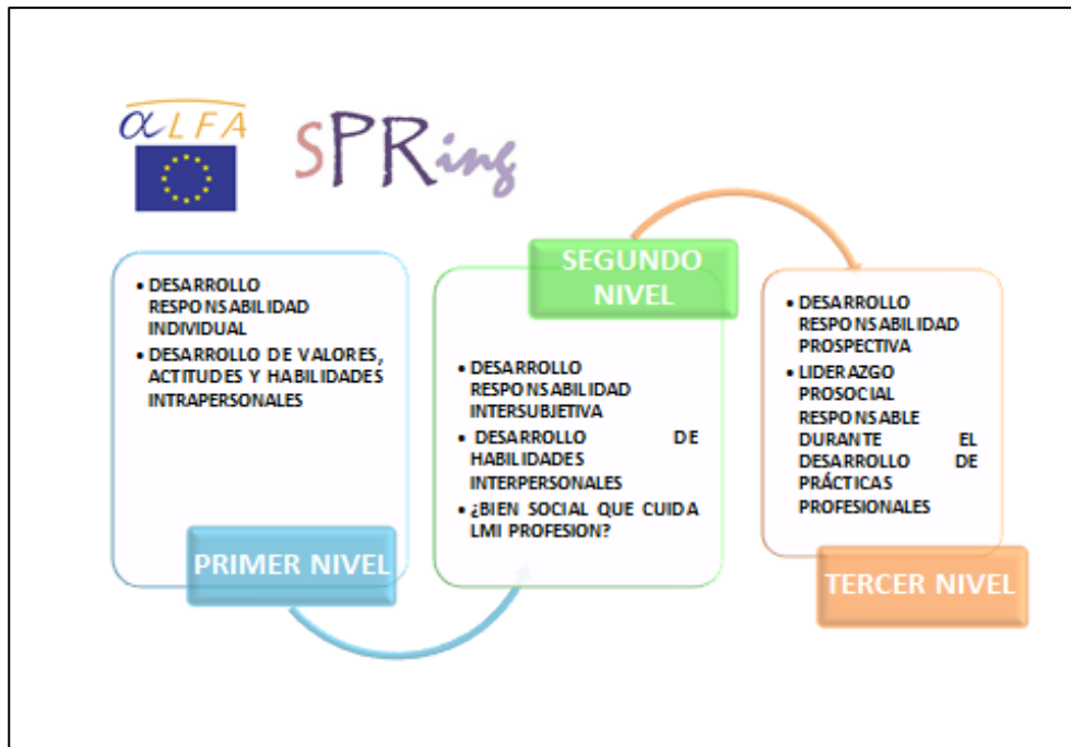
Figura 2 Modelo SPRING de itinerario curricular

Éste se ha ido implementando, y actualmente está presente en tres carreras. Formativamente considera un itinerario en tres etapas: Una de sensibilización cognitiva, que es institucionalmente abordada desde la formación fundamental. Una segunda, de valorización, que considera la formación disciplinar y propia de cada carrera. Una tercera, de integración, donde es el espacio de práctica profesional, bajo el concepto de “centros de confianza”, el que aporta curricularmente al logro de una competencia en responsabilidad social. El modelo es reforzado por la participación en proyectos de acción social, organizando un currículo flexible para el estudiante