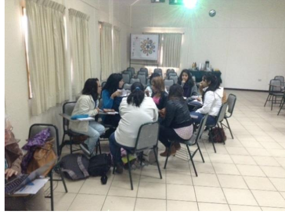
Figura 3 Talleres de trabajo con estudiantes

Este rediseño de la asignatura se hace a nivel de estructura de programa, con lo cual se ha logrado concretar durante la formación el trabajo de los estudiantes como parte de su formación profesional.