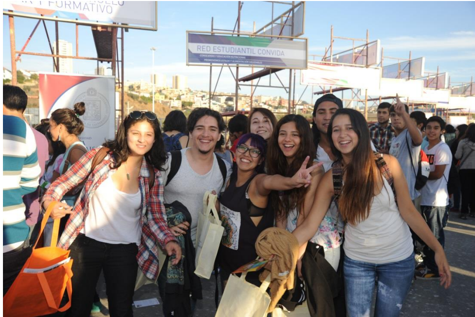
Feria de Servicios Universitarios, 2014

Se realizan convocatorias semanales, durante todo el periodo académico, a los estudiantes inscritos en las asignaturas. Los participantes, previa inscripción, asisten a sesiones de consultorías guiadas por profesores del Instituto de Matemática y del Instituto de Física, quienes se encargan de resolver consultas sobre problemas de contenido específico y entregan herramientas que facilitan la ejercitación y la resolución de problemas.