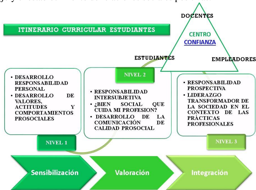
Figura 2 Modelo SPRING: Itinerario de formación en Responsabilidad Social de los estudiantes

Así mismo, el desafío es fortalecer comportamientos prosociales en la interacción con sus pares y con quienes le rodean en la vida universitaria y personal, de modo que reconozcan la importancia de los valores y principios que esto conlleva para el ejercicio profesional en contextos diversos, en la integración de grupos/equipos de trabajo y el establecimiento de relaciones sociales positivas.