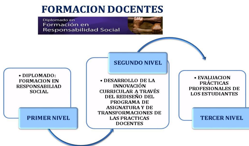
Figura 3 Modelo SPRING: Itinerario de formación de los docentes

En correspondencia con el modelo de formación de los estudiantes, se propone una diplomatura orientada a los docentes de la institución, que comporta tres niveles, como lo muestra la figura 3: