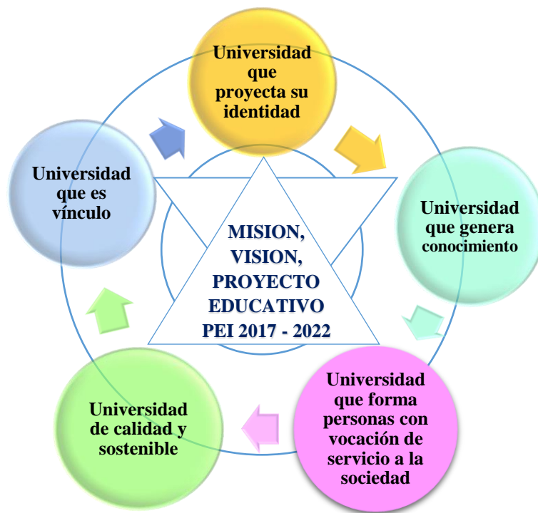
Figura 1 Lineamientos Estratégicos PUCV 2017 - 2022