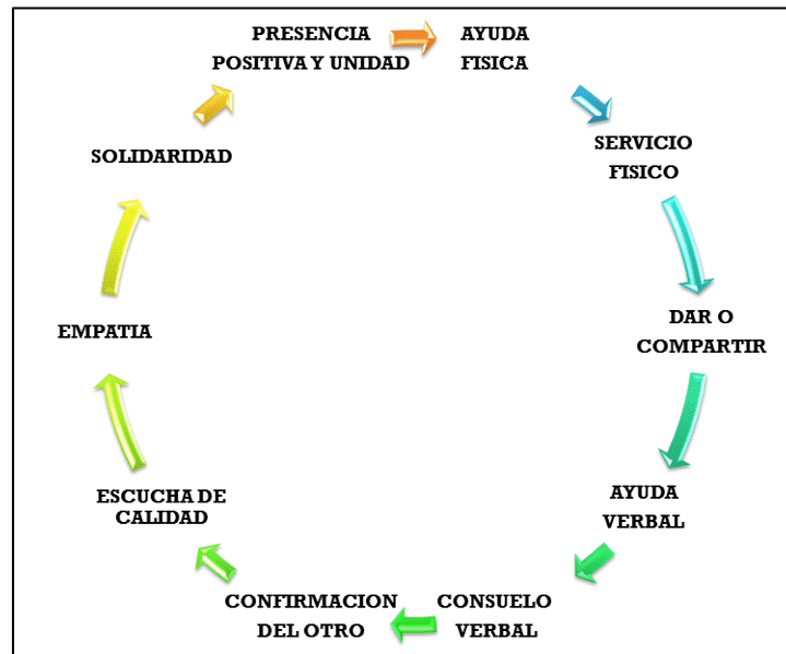
Figura 1 Comportamientos prosociales (Elaboración propia a partir de Roche, 1991)

Según el Laboratorio de Investigación Prosocial Aplicada, de la Facultad de Psicología de la Universidad Autónoma de Barcelona (LIPA, 2010), la prosocialidad en su definición operacional, se relaciona con los siguientes tipos de acciones que se observa en la Figura 1.