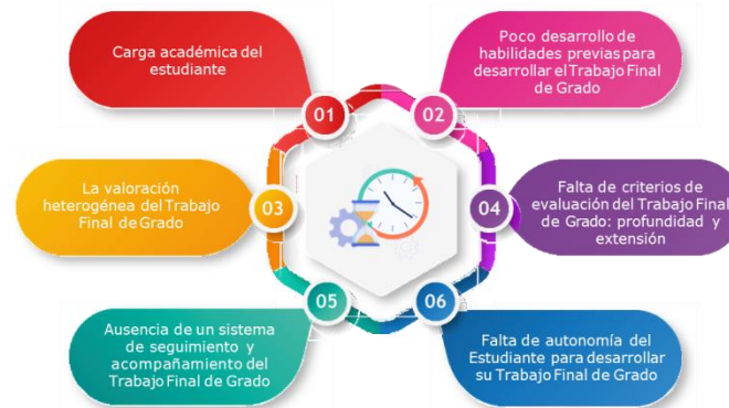
Figura 3: Cuadro detalle de retrasos por parte de los alumnos para el proceso de graduación