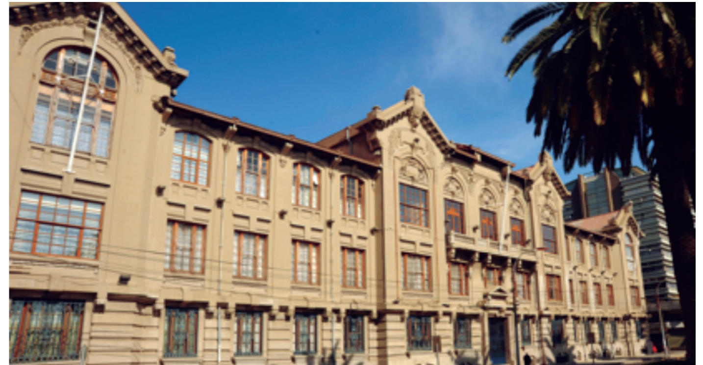
Sede Casa Central PUCV. Valparaíso

Los avances tecnológicos insospechados que se han dado en el mundo en las últimas décadas, así como la creciente generación de grandes volúmenes de datos (Big Data), demandan la formación de la persona con nuevas competencias en el ámbito de la Estadística. El programa Magister en Estadística, permite a través de su plan de estudios profundizar en temáticas relevantes de la disciplina, así como desarrollar las competencias demandadas por el medio laboral en la actualidad.