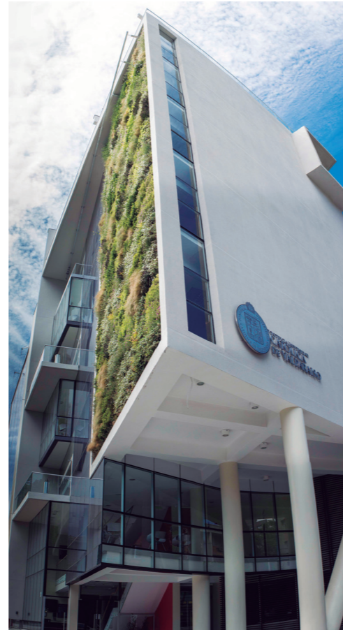
Sede Providencia PUCV. Santiago

PROYECCIÓN: En conexión con la Empresa, cuenta con académicos ligados al mundo laboral y contempla asignaturas optativas en temáticas de investigación muy recientes como Data Science, Big Data y Machine Learning.